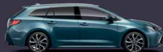
8U6 Acélkék §