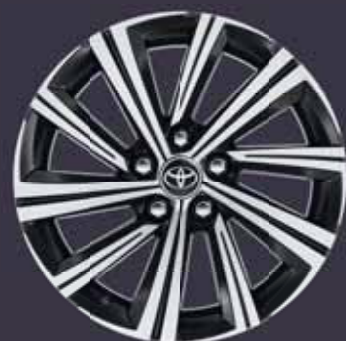
17" csiszolt hatású könnyűfém keréktárcsák (10 küllős) Alapfelszereltség: Style Tech