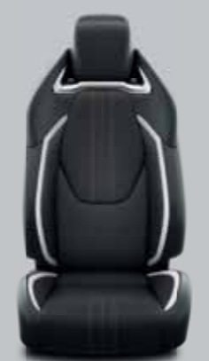
Sötétszürke szövet, fekete bőrhatású betétekkel, fényes króm díszcsíkkal Alapfelszereltség: GR-Sport