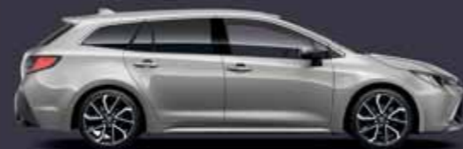
1J6 Krómezüst §