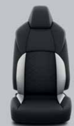
Fekete/szürke steppelt szövet, szürke varrással Alapfelszereltség: Comfort