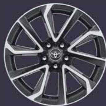
18" kéttónusú, szürke csiszolt hatású könnyűfém keréktárcsák (5 dupla küllős) Alapfelszereltség: Executive VIP