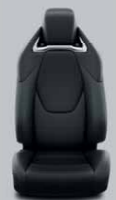
Fekete, perforált bőr & fényes króm díszcsíkkal Alapfelszereltség: Executive VIP