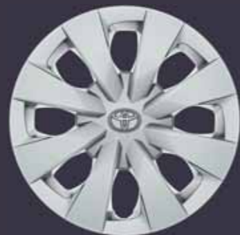
15" acél keréktárcsák dísz tárcsával (6 dupla küllős) Alapfelszereltség: Active