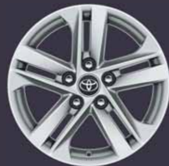
16" könnyűfém keréktárcsák (5 dupla küllős) Alapfelszereltség: Comfort