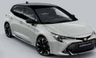
2RZ Higanyszürke § /Éjfékete §