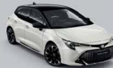
2PU Platina gyöngy*/Éjfékete §