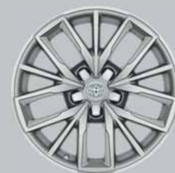
17" ezüst színű könnyűfém keréktárcsák (5 tripla küllős)