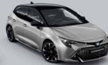
2RD Krómezüst § /Éjfékete §