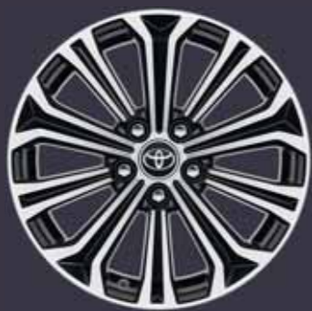
17" fekete csiszolt hatású könnyűfém keréktárcsák (10 küllős) Alapfelszereltség: Executive