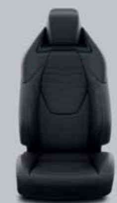
Fekete szövet, bőr betétekkel, piros varrással & fekete díszítéssel Alapfelszereltség: Executive