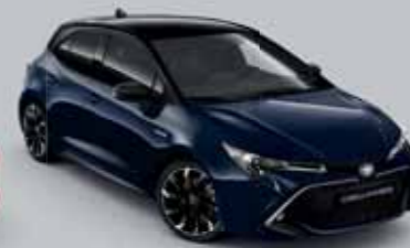
2UQ Sötétkék § /Éjfékete §