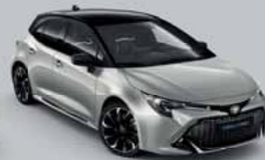
2TX Prémium ezüst § /Éjfékete §