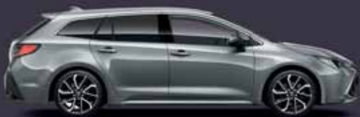
1H5 Manhattan szürke §