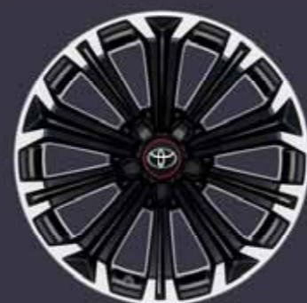
17" csiszolt hatású könnyűfém keréktárcsák (10 küllős) Alapfelszereltség: GR Sport