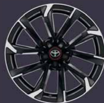
18" kéttónusú fekete csiszolt hatású könnyűfém keréktárcsák (5 duplaküllős) Alapfelszereltség: GR Sport Dynamic