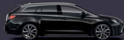
209 Éjfékete §