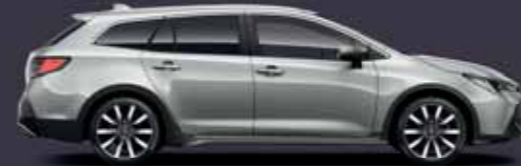
1L0 Prémium ezüst §