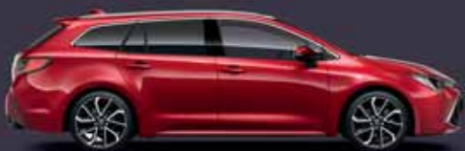
3U5 Érzéki vörös §