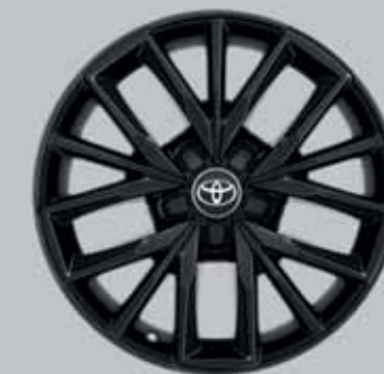
17" fekete könnyűfém keréktárcsák (5 tripla küllős)