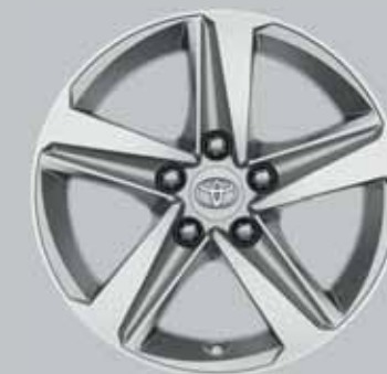
16" ezüst színű könnyűfém keréktárcsák