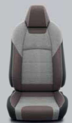
Barna szövet szürke betétekkel szürke varrással Alapfelszereltség: TREK