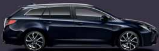
8X8 Sötétkék §