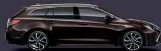
4W9 Kávébarna §