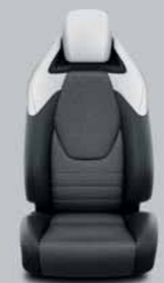
Fekete/szürke szövet, bőr betétekkel & fekete díszcsíkkal Alapfelszereltség: Executive