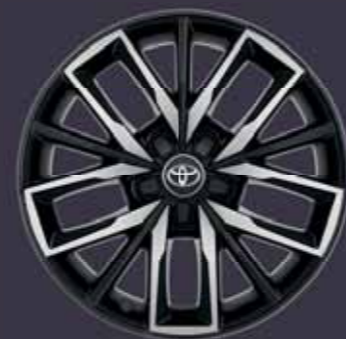
17" fekete csiszolt hatású könnyűfém keréktárcsák Alapfelszereltség: TREK