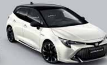
2NR Hófehér/Éjfékete §