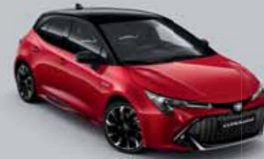
2SZ Érzéki vörös § /Éjfékete §