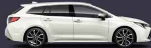
089 Platina gyöngy* §