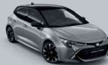
2QS Manhattan szürke § /Éjfékete §