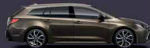
6X1 Barnászöld §