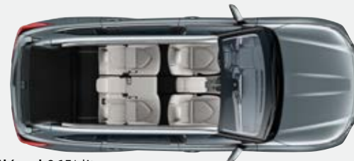
5 ülésel 865* liter