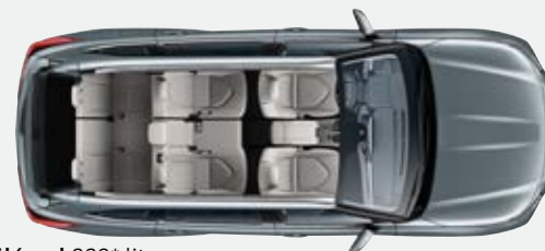
7 ülésel 332* liter

A Highlander kiválóan variálható ülésrendszere minden igényhez, minden úticélhoz alkalmazkodik.