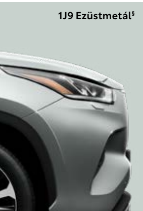
1J9 Ezüstmetál §