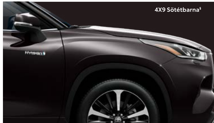
4X9 Sötétbarna §