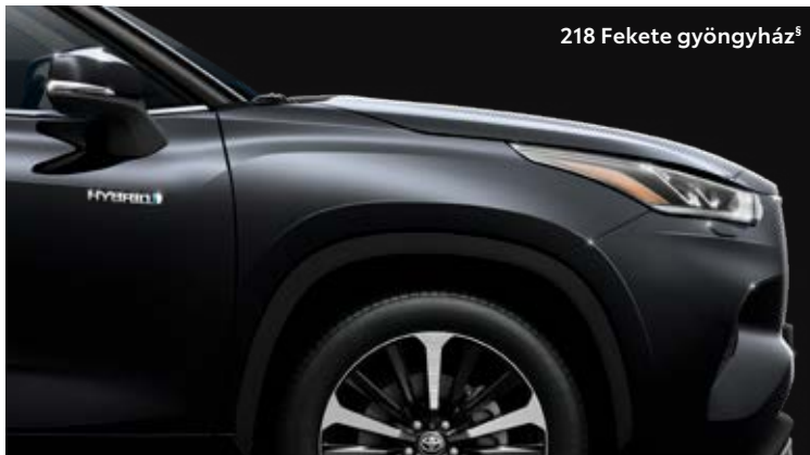
218 Fekete gyöngyház §