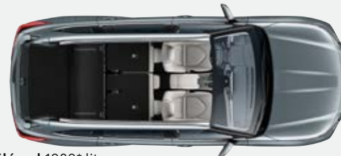
2 ülésel 1909* liter