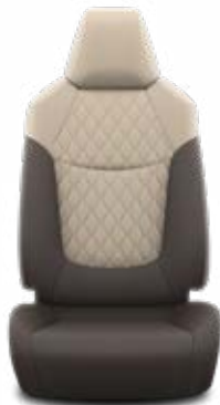
Sötétbarna szövet ülésborítás steppelt bézs betétekkel

Alapfelszereltség az Executive és Hybrid Executive felszereltségnél