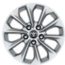
16" könnyűfém keréktárcsák (10 küllős) Alapfelszereltség a Hybrid Active, Comfort és Hybrid Comfort felszereltségnél