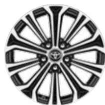
17" kéttónusú fekete, csiszolt hatású könnyűfém keréktárcsák (10 küllős) Alapfelszereltség a Comfort Style, Hybrid Comfort Style, Executive és Hybrid Executive felszereltségnél