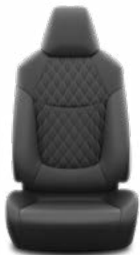
Fekete szövet ülésborítás bőr részekkel és steppelt betétekkel, bézs varrással

Alapfelszereltség az Executive és Hybrid Executive felszereltségnél