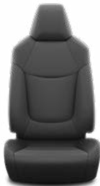
Fekete szövet ülésborítás

Alapfelszereltség az Active felszereltségnél