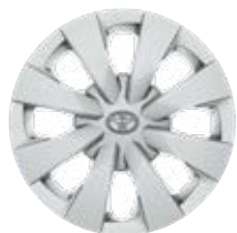
15" acél keréktárcsák dísz tárcsával (8 küllős) Alapfelszereltség az Active felszereltségnél