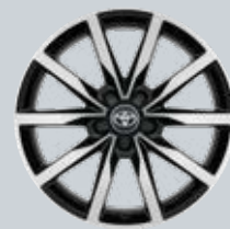
18" fekete színű könnyűfém keréktárcsák (5 duplaküllős) Tartozékként rendelhető az Executive felszereltséghez