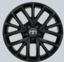
17" fekete színű könnyűfém keréktárcsák Tartozékként rendelhető a Comfort felszereltséghez