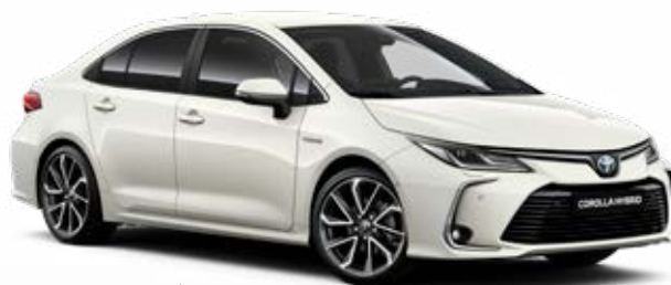
070 Gyöngyfehér §