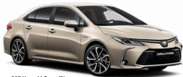
587 Homokkő metál*