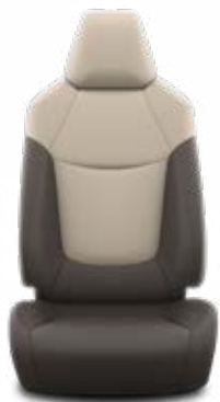
Sötétbarna szövet ülésborítás bézs betétekkel

Alapfelszereltség az Active felszereltségnél