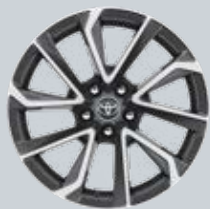
18" kéttónusú, szürke, csiszolt hatású könnyűfém keréktárcsák (5 dupla küllős) Opcióként rendelhető az Executive és Hybrid Executive felszereltségnél (VIP csomag)