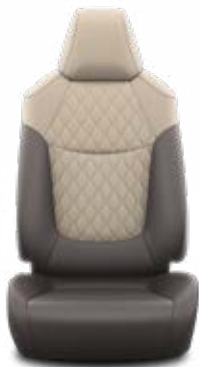
Sötétbarna szövet ülésborítás bőr részekkel és steppelt bézs betétekkel, bézs varrással

Alapfelszereltség az Active felszereltségnél