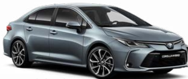
1K3 Szürkéskék metál*