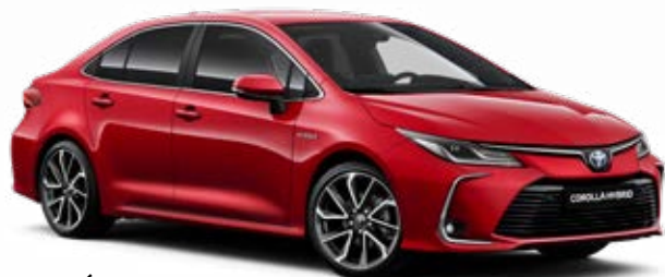
3U5 Érzéki vörös §