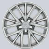
17" ezüst színű könnyűfém keréktárcsák Tartozékként rendelhető a Comfort felszereltséghez