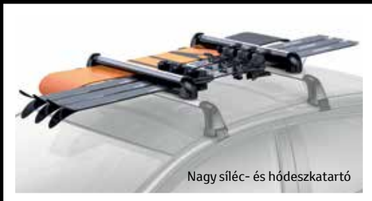
Nagy síléc- és hódeszkatartó