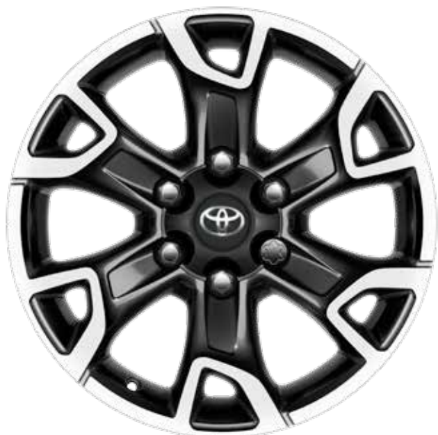
18" 6 küllős, csiszolt fekete könnyűfém keréktárcsa