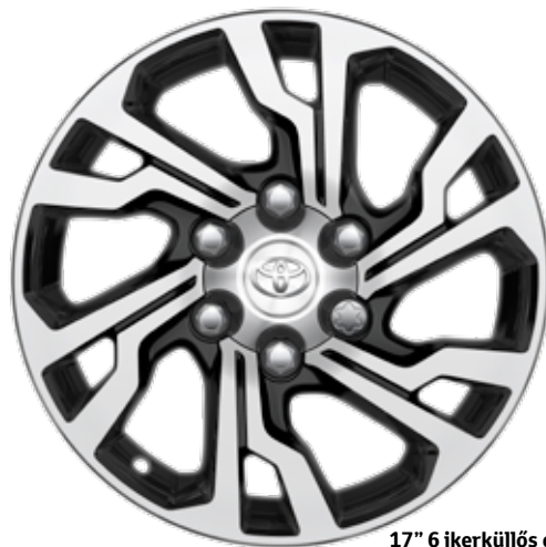
17" 6 ikerküllős csiszolt fekete könnyűfém keréktárcsa