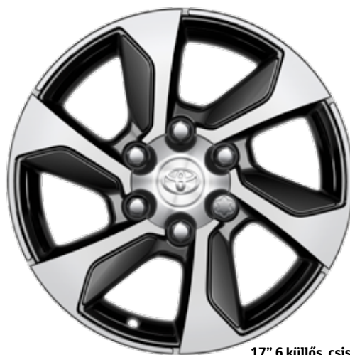
17" 6 küllős, csiszolt fekete könnyűfém keréktárcsa